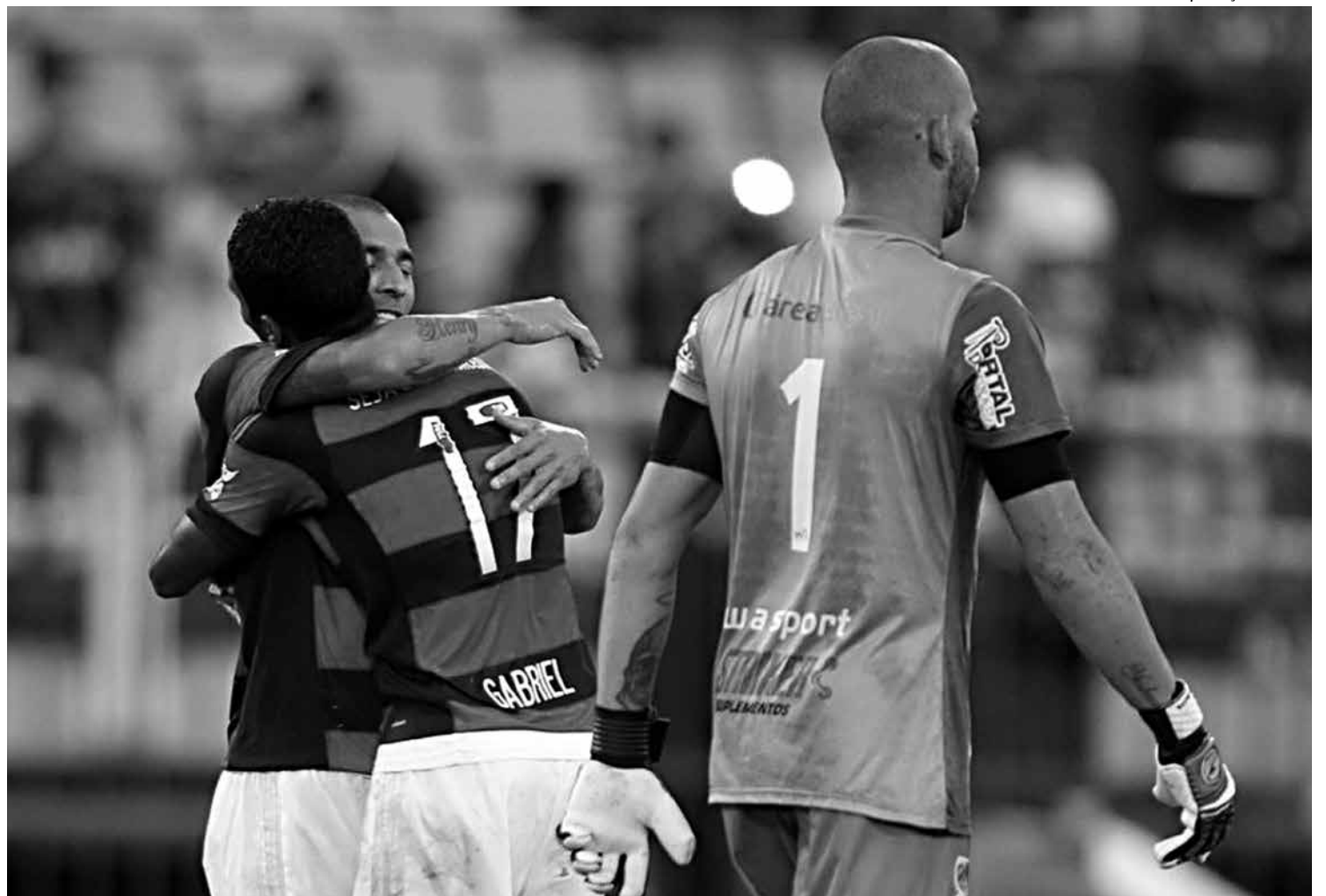
O Flamengo começa a sua caminhada amanhã em Aracaju, diante do Confiança, jogo que deve registrar um grande público no Batistão

O Vitória fará caminho parecido ao do Asa, percorrendo basicamente a mesma distância para o duelo contra o Náutico. São cerca de três mil quilômetros entre Salvador e Caracaraí, em Roraima, município em que jogará contra o seu oponente na primeira fase.