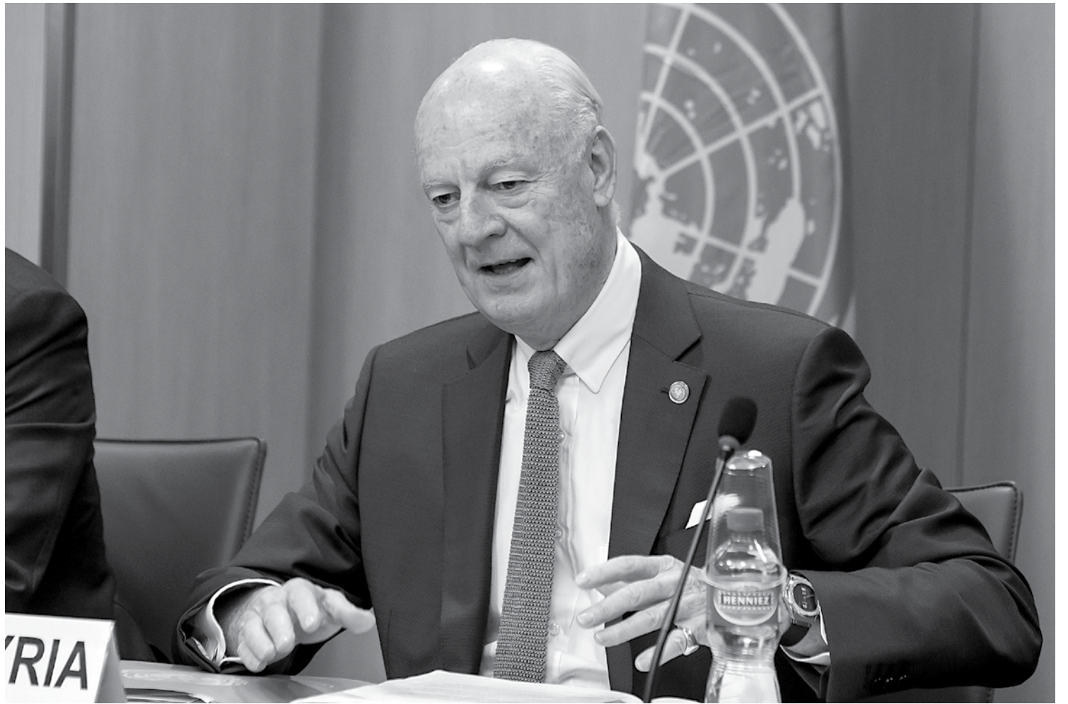
O enviado da ONU, Staffan de Mistura, discutiu com o governo sírio questões relacionadas com o processo de paz no país

"Queremos negociar como sírios, com a liderança síria e sem intervenção estrangeira", disse Jaafari