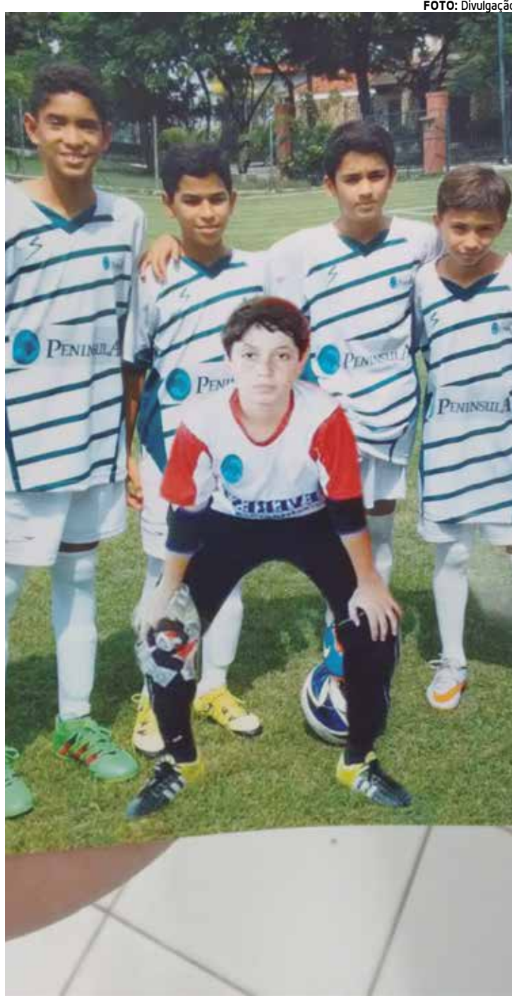
Cinco garotos da Paraíba vão jogar pelo time do Península-RJ