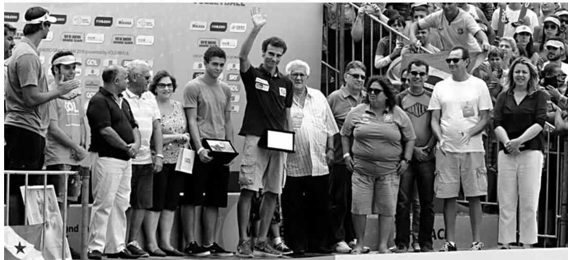
O jogador de vôlei de praia recebeu diversas condecorações em Copacabana ao deixar o esporte

O ministro do Esporte, George Hilton, entregou uma placa ao multicampeão, que ainda ganhou homenagens de patrocinadores e da Confederação Brasileira de Vôlei (CBV).