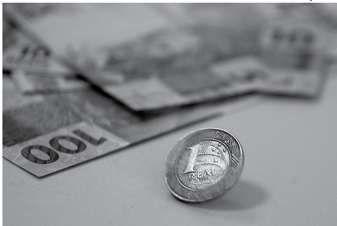
Para o empreendedor com receita bruta anual acima de R$ 90 mi os juros caem de 15,29% para 12,95%

A nota esclarece, ainda, que a medida terá impacto negativo no patrimônio líquido dos fundos de R$ 1,8 bilhão e os encargos financeiros previstos na resolução poderão ser aplicados, mediante