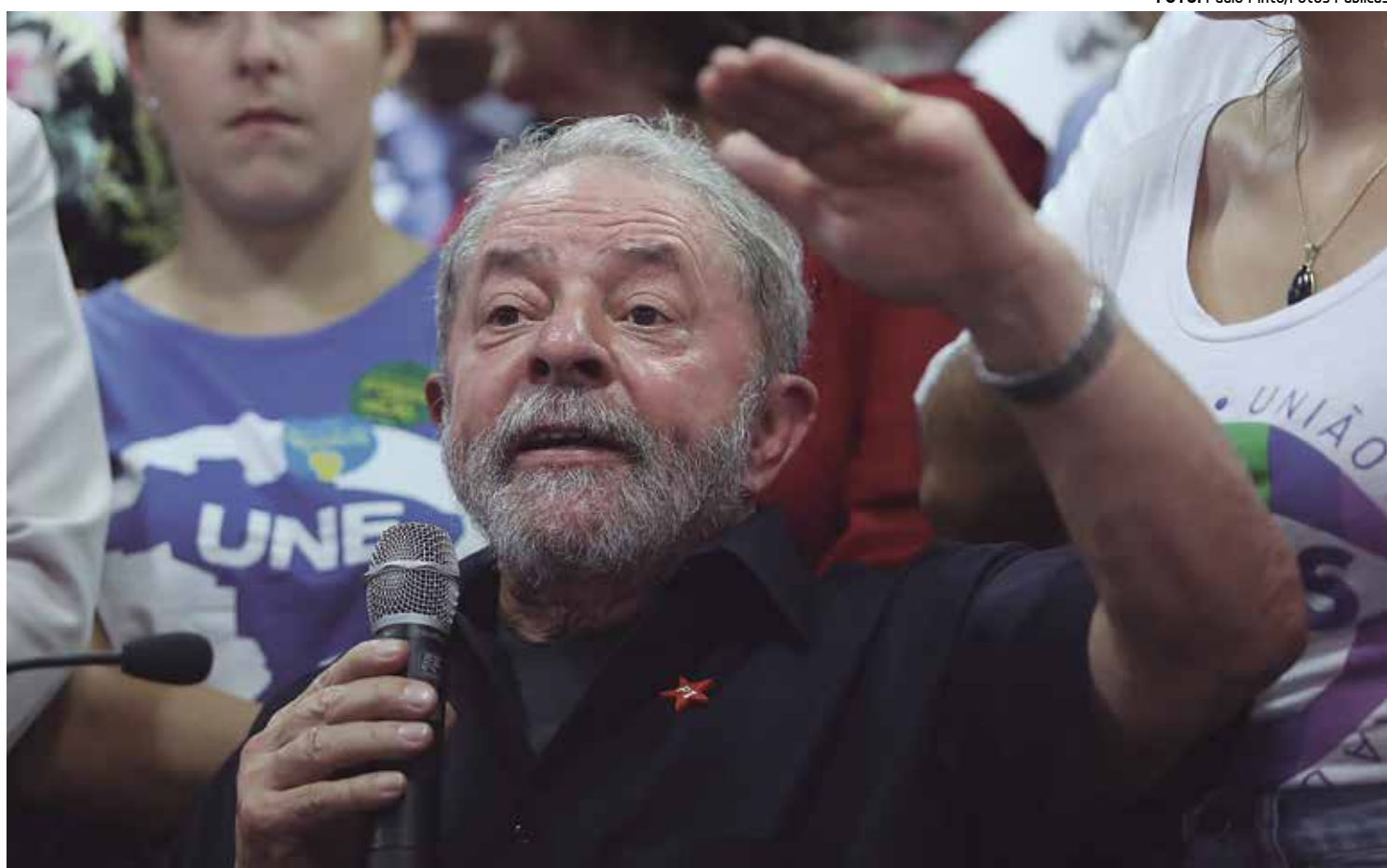
O ex-presidente Lula afirmou que as ofensas que vem recebendo no país farão com que se candidate a presidente nas eleições de 2018